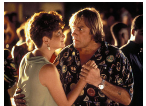
1994 MY FATHER, CE HÉROS (My Father the Hero) de Steve Miner avec Gérard Depardieu