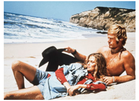
1970 L'ULTIME RANDONNÉE (Little Fauss and Big Halsy) de Sidney J. Furie avec Robert Redford