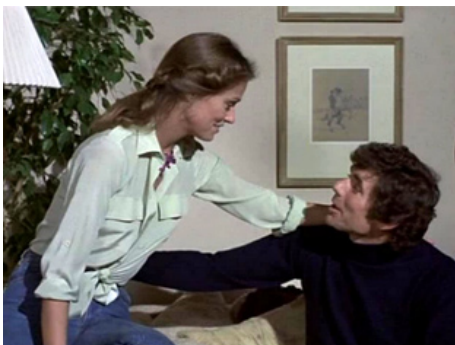
1978 MEURTRE AU 43 E ÉTAGE (Someone's watching me) de John Carpenter avec David Birney