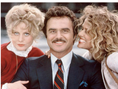
1981 PATERNITÉ (Paternity) de David Steinberg avec Beverly D'Angelo, Burt Reynolds