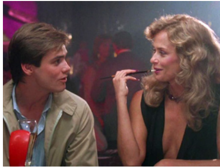
1985 VAMPIRE FOREVER (One Bitten) d'Howard Storm avec Jim Carrey