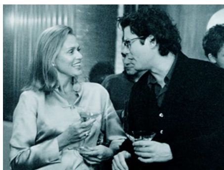
1998 SEXE, STRIP-TEASE ET TEQUILA (Just a little harmless Sex) de R. Rosenthal avec William Ragsdale