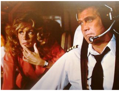
1983 STARFLIGHT ONE (Starflight, the Plane that could'nt land) de Jerry Jameson avec Lee Majors