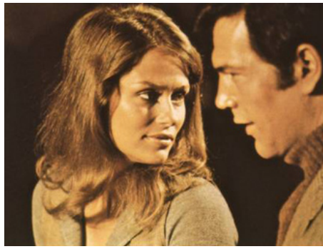
1970 PIECES OF DREAMS (Piece of Dreams) de Daniel Haller avec Robert Forster