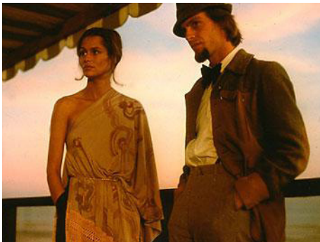
1976 BIENVENUE À LOS ANGELES (Welcome to L.A.) d'Alan Rudolph avec Keith Carradine