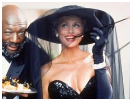
1991 GUILTY AS CHARGED de Sam Irvin avec Isaac Hayes