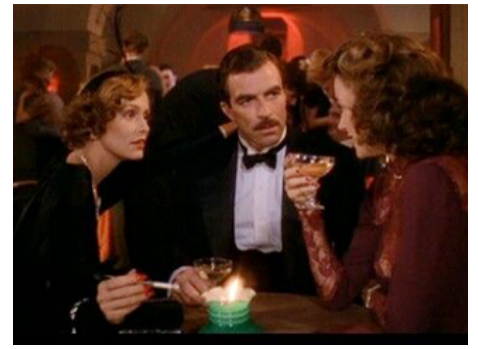
1984 SIGNÉ LASSITER (Lassiter) de Roger Young avec Tom Selleck, Jane Seymour