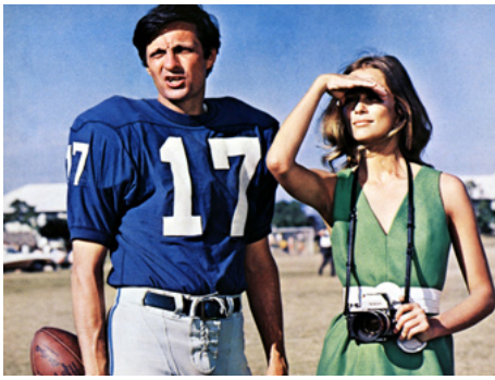
1969 LE LION DE PAPIER (Paper Lion) d'Alex March avec Alan Alda