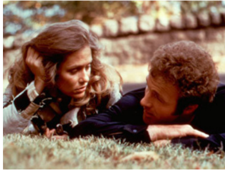
1974 LE FLAMBEUR (The Gambler) de Karel Reisz avec James Caan