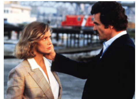
1987 MALONE, UN TUEUR EN ENFER (Malone) d'Harley Cokeliss avec Burt Reynolds