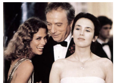
1982 TOUT FEU, TOUT FLAMME de Jean-Paul Rappeneau avec Yves Montand, Isabelle Adjani