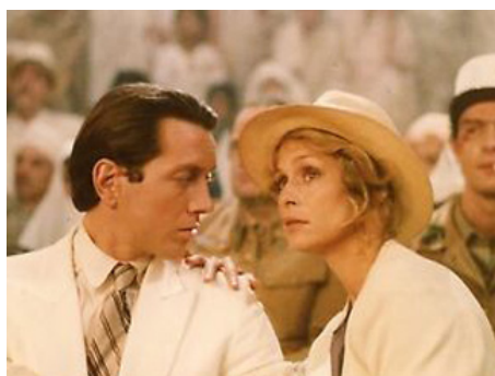
1982 HÉCATE, MAÎTRESSE DE LA NUIT de Daniel Schmidt avec Bernard Giraudeau