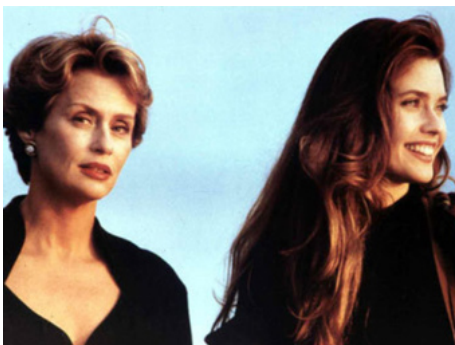
1991 MILLIONS (Miliardi) de Carlo Vanzina avec Carol Alt