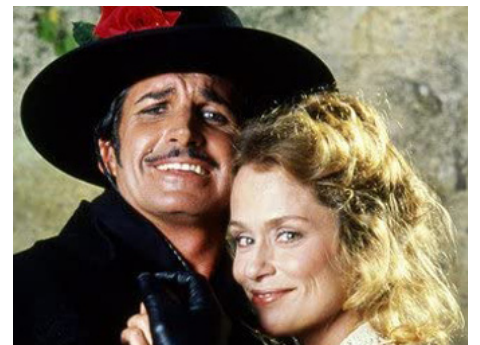
1981 LA GRANDE ZORRO (The Gay Blade) de Peter Medak avec George Hamilton