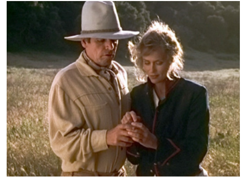
1986 TUEUR DU FUTUR (Timestalkers) de Michael Schulz avec William Devane