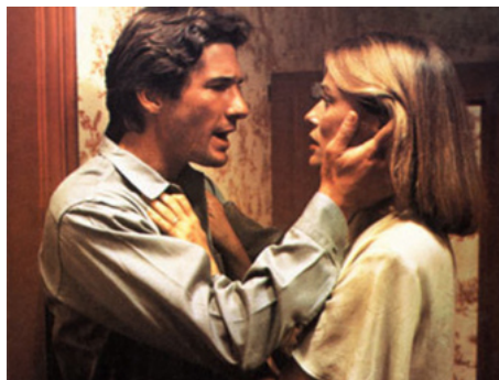
1980 AMERICAN GIGOLO (American Gigolo) de Paul Schrader avec Richard Gere