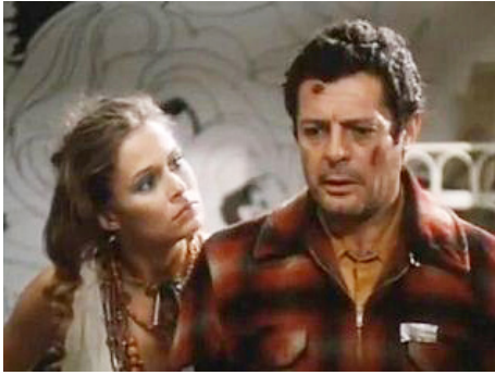
1971 LE RAVI (Permette ? Rocco Papaleo) d'Ettore Scola avec Marcello Mastroianni