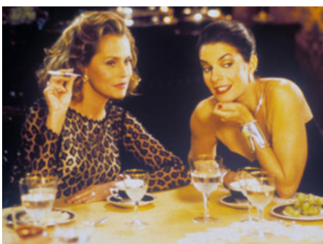
1998 STUDIO 54 (54) de Mark Christopher avec Sella Ward