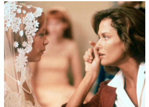
1978 UN MARIAGE (A Wedding) de Robert Altman avec Sissy Spacek