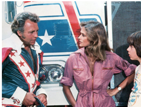
1977 LE CASSE-COU (Viva Knievel) de Gordon Douglas avec Evel Knievel