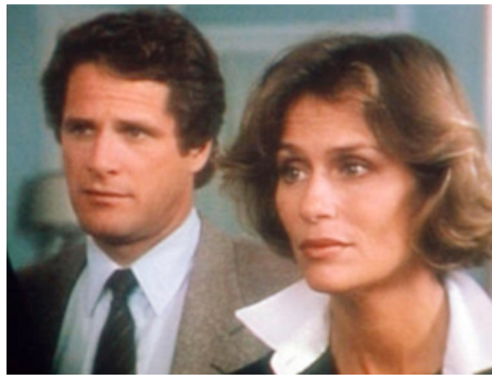
1983 LA CLINIQUE DU DOCTEUR H (The Cradle will fall) de John Llewelyn Moxey avec Ben Murphy